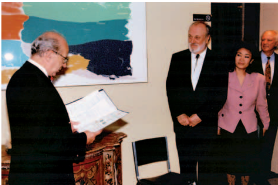
Kurt Masur erhält die AES-Ehrenmitgliedschaft in New York

hört in eine Hand, bis zum Sender. Das war auch eine Frage des Etats. Das Rundfunkkomitee brauchte das Geld für die Redaktion und das Programm – schließlich war das ein politisches Instrument im Kalten Krieg. Aber was heißt eigentlich Kalter Krieg? – Die Musikredaktionen tauschten auch zu dieser Zeit munter Bänder aus! Ich habe ab 1960 unsere Aufnahmen der elektronischen Musik durch die ganze Welt gesendet. Das war internationaler Rundfunk und das war von der DDR auch gewollt, damit die Qualität mithalten konnte.