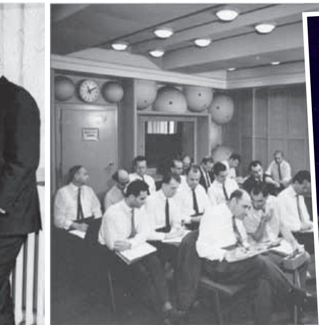
1966 - Fachgruppe des OIRT im RFZ-Abhörraum