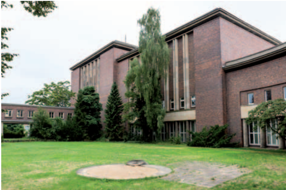
Der Produktionskomplex B mit den Sälen 1 und 2

Friedemann Kootz: Also haben sich beide Seiten auch immer ernst genommen.